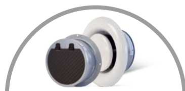
BRANDSCHUTZVENTIL FÜR ABLUFT MIT KALTRAUCHSPERRE | TYP BRAV-K-A-KRS-M Ausführung wie BRAV-K-A, jedoch mit integrierter Kaltrauchsperr KRS-M mit Magnetverschluss