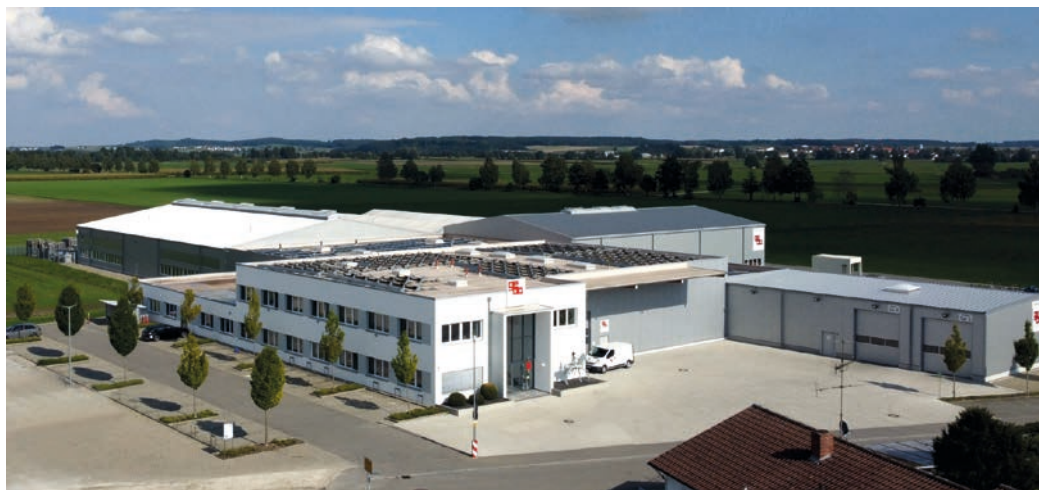
geba Emerkingen 2025