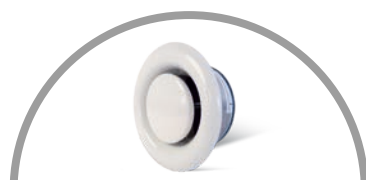
BRANDSCHUTZVENTIL FÜR ABLUFT | TYP BRAV-K-A für Abluft in Lüftungsanlagen nach DIN 18017-3 Zulassungs-Nr. 41.3-669, RAL 9010