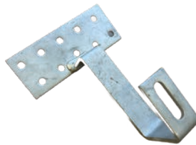
SDPV DACHHAKEN 1x SDPV Haken, Edelstahl 1.4016/1.4301 Dachhakenschrauben sind nicht im Lieferumfang enthalten